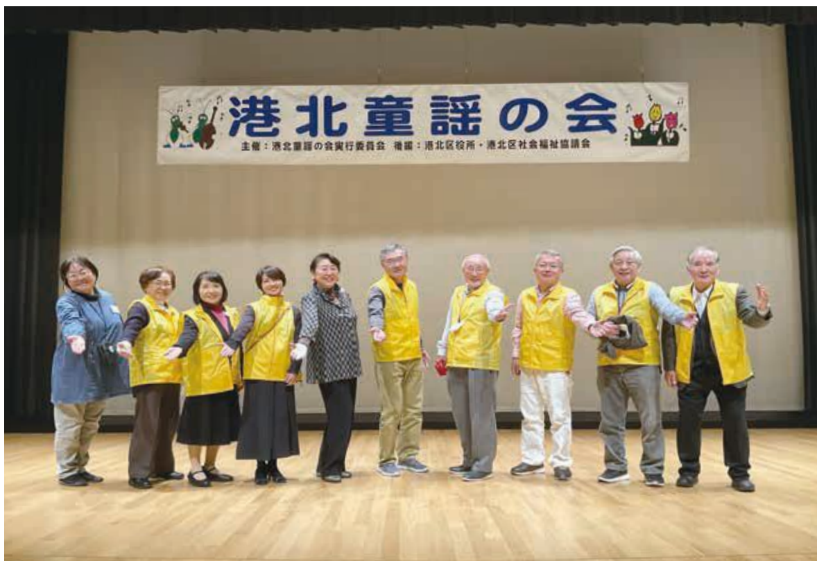
(港北童謡の会の皆さん)