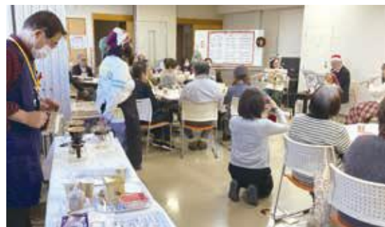
「カフェ・ド・らんらん」コラボイベント

「カフェ・ド・らんらん」は、新羽地域ケアプラザ主催の「コーヒーボランティア養成講座」の修了生が集まり、6年前に立ち上げた美味しいコーヒーとおしゃべりを楽しむサロンです。現在8名のコーヒーボランティアらんらんのメンバーが運営しています。コーヒーは、豆を10gずつ丁寧に量り、時間を計って挽き、ハンドドリッパーで一杯一杯心を込めて淹れます。ボランティアによる音楽の生演奏もあります。取材日は、施設利用団体の「しふおん(パンづくり)」と「緑交響楽団」とのコラボイベントでした。軽やかなフルーツ三重奏の音色に耳を傾けながら美味しいコーヒーとパンをいただきました。