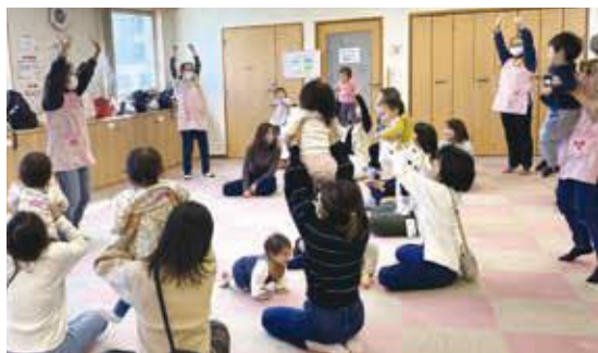
みんな一緒に、たかいたか〜い！

当日は予約なし自由参加なので、ママたちは「ひさしぶり〜！」「はじめまして」の挨拶から始まります。自由に遊んだあと、この日は、普段家庭で使わない工作のりの感触を楽しみながら、紙コップを利用した「みのむし」を作りました。「常にいろいろな人がいて、話しをしたり、子どもたちも自由に遊んだり、そういう時間を一番大切にしています。」と、代表者のお話でした。