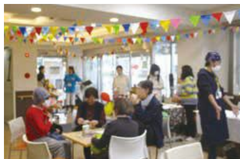
につぱらつぱフェスティバルの様子

昨年(2023年)11月25日(土)、26日(日)に、「につぱらつぱフェスティバル」が開催されました。登録団体によるダンス、太極拳、コーラス、絵手紙、水彩画、草木染、朗読、スイーツ・パン作りなどの活動体験や作品展示、保健活動推進員による健康チェックなどに、子どもからシニアまで多くの人々が楽しく参加しました。他にも作業所によるマルシェや子ども向けお楽しみコーナー、横浜市営バスのミニバス乗車などもあり、全館あげて盛りだくさんの2日間でした。