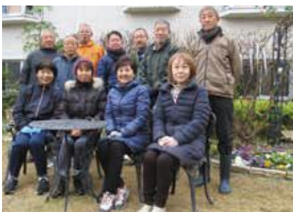
グリーンコーポ篠原 花と緑の会の皆さん

「游学スポット」ならび「登録グループからの会員募集」の締切は 2月28日(水) です。概ね4月10日～6月10日迄のイベント情報をお寄せください。詳しくは区民活動支援センターまで!