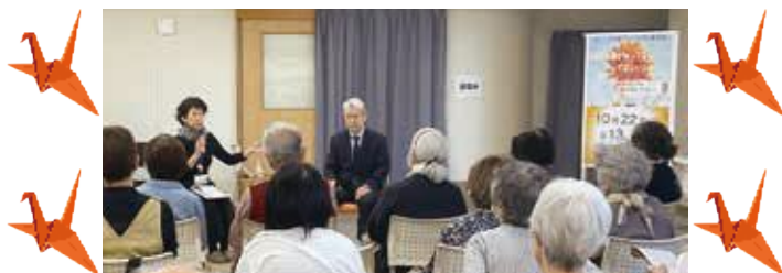
オレンジ大使講演会の様子

9月21日の「世界アルツハイマーデー」にちなみ、毎年この時期に「オレンジの輪プロジェクト」を実施しています。認知症の方もそのご家族も「誰もが安心して暮らせる町 新羽」として、地域の皆さんと一緒に認知症について考えています。認知症のシンボルカラーであるオレンジ色の鶴を折ってケアプラザに展示したり、ドキュメンタリー映画の上映会、認知症サポーター養成講座などを通じて認知症への理解の輪を広げていきます。取材日(10/22)は、認知症当事者である「かながわオレンジ大使」講演会でした。認知症だと自覚した瞬間の状況や、「認知症」の知識、早期発見、早期治療の重要性、家族との会話から理解を得るまでの過程などを聴きました。参加者の「知ることは大切、不安はあるがやれることをやっていきたい。」との前向きな感想も聞きました。