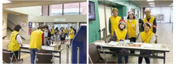
笑顔でお出迎える運営メンバーのみなさん

コロナ禍では、ホールに集まって歌うことは、飛沫感染リスクを高めるという理由で許されなくなりました。後に、感染予防対策を徹底した上で再開するも、感染拡大に歯止めがかからず再びの中止へ。新型コロナウイルス感染症に翻弄される月日が続きました。