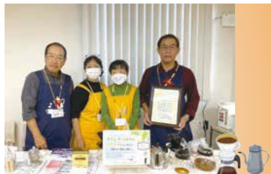
「コーヒーボランティアらんらん」の皆さん

「コーヒーボランティアらんらん」は横浜市、「たんぽぽにつぱ」は港北区の社会福祉大会の福祉活動功労団体として表彰されました。