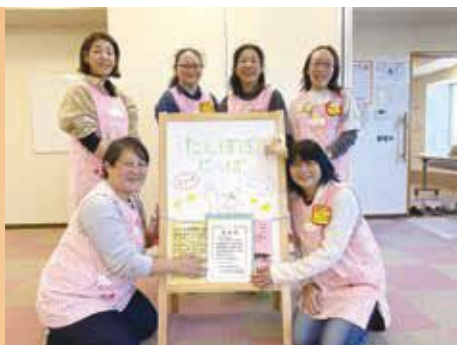
「たんぽぽにつぱ」の皆さん