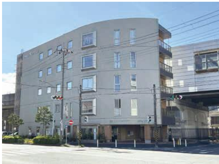
新羽地域ケアプラザ・コミュニティハウス外観

今年(2024年)5月に開所から10周年を迎える新羽地域ケアプラザ・コミュニティハウス。地域ケアプラザとコミュニティハウスの合築は珍しく、地域ケアプラザの特徴である「子どもから高齢者まで、地域の誰もが住み慣れた街で暮らせるよう、身近な福祉・保健・交流の拠点」としての役割と、コミュニティハウスの特徴である「地域の皆さまに身近な生涯学習や地域活動の場」の両方の強みが混ざり合った施設として、地域の方々のさまざまな活動に利用されています。最寄り駅からすぐ近く、立地条件にも恵まれた「新羽地域ケアプラザ・コミュニティハウス」の取り組みをご紹介します。