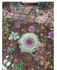
季節のしつらえ(12月撮影)

集合住宅敷地内の中庭で、月3回、日曜日の午前中に活動しています。今年で発足14年目。憩いの広場の緑化と、住民同士の交流・健康にも一役買っています。 2021年によこはま緑の推進団体(市内で約800団体が登録)の<最優秀活動賞>を受賞しました。