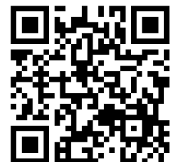
過去の実行委員会経緯